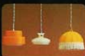
6125 Taklampa, gul. 6126 Taklampa, vit. 6178 Taklampa, tyg

Det är lätt att ordna belysning i hela Lundby dockhuset. Gör bara så här: På baksidan av huset finns ett urtag med plats för Lundbytransformatorn. Det är lätt att koppla in – följ bara anvisningarna som följer med. Vad som händer i transformatorn är att den förvandlar hushållsströmmen till ofarlig "lekström" (4,5V). Sedan kan du utan risk koppla in olika lampor överallt i dockhuset. Det blir verkligen tjustigt, särskilt om du har lite mörkt i rummet.