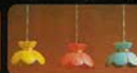
6147 Tiffany-lampa. Finns i tre färger. 6169 Bordslampa Romantica. 6160 Bordslampa de luxe.