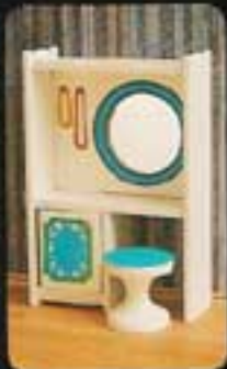
7180 Toalettbord med päll, Blue Heaven.