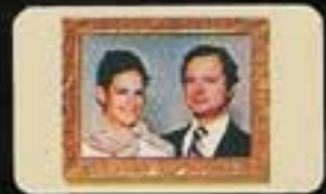
6616 Tavla, Kungaparet.