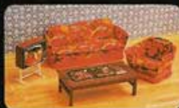
9543 TV-salong 5341 Soffa Europa. 5351 Fåtölj Europa. 5352 Sofbord emalj. 5196 Färg-TV med lampa.