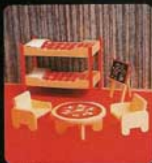
9752 Barnkammare. 7501 Våningsäng. 7503 Bord och två stolar. 7504 Rittavia.

Här har du fyra sovrumsmöblemang att välja bland. Tre för vuxna och ett för barnkammaren. I ett hus med flera sovrum är det ju trevligt att kunna möblera dem olika, eller hur?