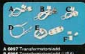
A 6097 Transformatorsladd. B 6095 Transformatorsladd (USA). C 6321 Förlängningskabel. D 6196 2-gödlampor med stödd. E 6512 Fordelare. F 6192 12 dubbla stickkontakter.