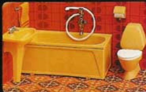
9881 Badrum, rött kakel. 8861 WC-stol och matla. 8842 Tvättstäl med handdukvägg. 8843 Badkar med rött kakelvägg.