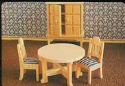
9310 Matsal Fur. 3200 Matbord Fur. 3201 Fyra stolar Fur. 3202 Skåp Fur.