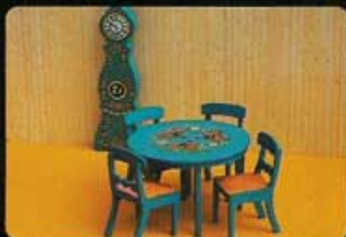
9350 Matsal, blå. 4406 Matbord, blått. 4407 Fyra stolar, blå. 4415 Moraklocka, blå.

Den moderna matsalsmöbelen i vackert ådrad äkta lur har med rätta blivit omtyckt runt om i världen. Du kan också välja årets nyhet – Matsal Classic i mahognyfärg. Dessutom har du den klassiska elfenbensfärgade Matsal Royal och två rustika matsalsmöblemang som också passar i köket.