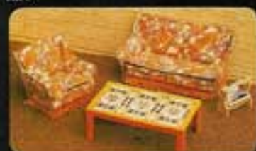
9521 Salong Elegance III. 5220 Goffa Elegance. 5221 Fåtölj Elegance. 5222 Sofbord kakel. 6855 Tidningsstäl.