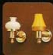
6174 Lampett, gul. 6175 Lampett, vit.