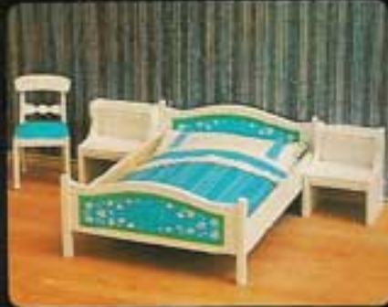
9719 Sovrum Blue Heaven. 7105 Nattbord, vitt. 7186 Dubbsäng Blue Heaven. Stol, Blue Heaven (säljes ej separat).

Här har du fyra sovrumsmöblemang att välja bland. Tre för vuxna och ett för barnkammaren. I ett hus med flera sovrum är det ju trevligt att kunna möblera dem olika, eller hur?