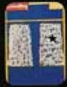
6332 Gardin Classic.