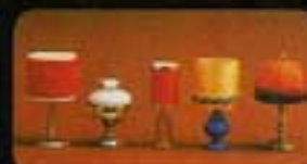
6167 Bordslampa med röd sammet. 6168 Bordslampa fotogen. 6164 Bordslampa mässing.