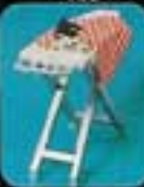
6613 Strykbräda och strykjärn.