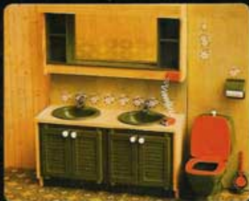
9835 Badrum i grönt kakel, I. 8830 WC-stol med grön kakelvägg. 8832 Tvättstäl med badrumsskåp.

I Lundby dockhus finns plats för ett stort välinrett badrum. Du kan välja mellan grönt eller rött kakel - det är en smaksak. Och belysningen för tvättstället 8832 ordnar du med lampset 6120 (se sid 15) så blir det riktigt mysigt.