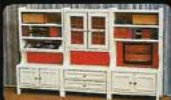
9541 Bokhyllvägg, vit. 5381 Vitinskåp, vit. 5382 Bokhylla, vit. 5383 Bokhylla med tidskriftshylla, vit.

När du skall möblera vardagsrummet har du verkligen mycket att välja på. Effenbensfärgade Salong Royal och Musiksalongen samt den vita bokhyllvägg. Men som du ser finns det också flera andra möjligheter. Varför inte fur?