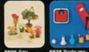
6605 Sax blommor. 6606 Tulpaner i vas.