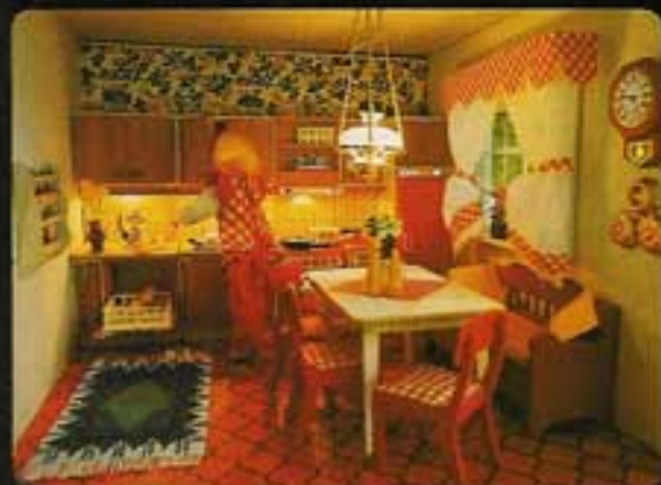
9275 Kök Continental III. 2500 Köksbord. 2511 Fyra köksstolar. 2532 Kökspisenhet. 2542 Diskbänkenhet.