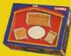
0408 Salong Royal