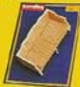
4380 Sofa Royal