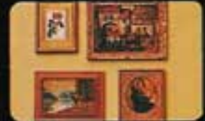
6615 Fyra tavlor.