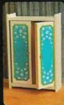
7181 Klädkåp Blue Heaven.