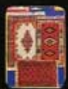
6287 Mattor Persia.