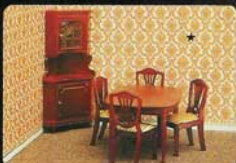
9400 Matsal Classic. 4350 Matbord Classic. 4351 Fyra stolar Classic. 4352 Hörnskåp Classic.