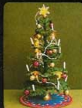
6121 Julgransbelysning (utan julgräs).