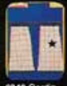
6342 Gardin Modern.