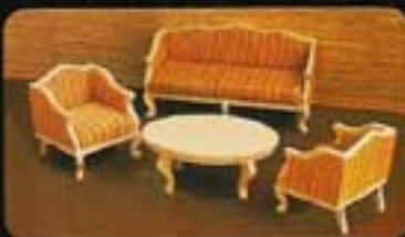
9406 Salong Royal. 4390 Soffa Royal. 4381 Fåtölj Royal. 4382 Sofbord Royal.