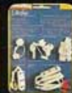
6570 Lundby Electric, för andra dockskåp.