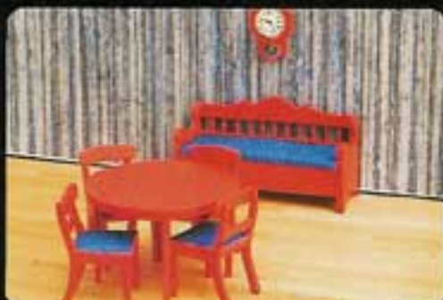
9340 Matsal, röd. 3116 Matbord, rött. 3117 Fyra stolar, röda. 3135 Våggur, rött. 3140 Älmmögesoffa, röd.