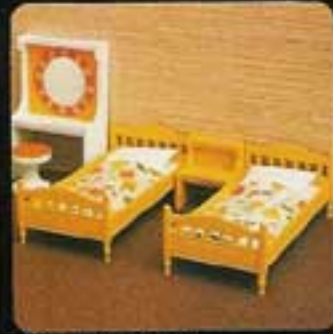
9718 Sovrum Nocturne. 7104 Nattbord, gult. 7116 Toalettbord med päll Nocturne. 7286 Enkelsäng Nocturne.