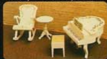
9419 Musiksalong 4113 Pelarbord 4319 Fygel med pall 4327 Gungstol Royal.