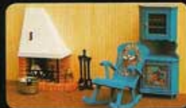
9525 Scandia. 4329 Gungstol, blå (i rött nr 3195). 4455 Hömskåp, blått. 5774 Öppen spis med belysning. 5780 Tre spållbehör.