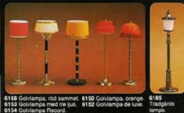
6158 Golvampa, röd sammet. 6150 Golvampa, orange. 6153 Golvampa med tre ljus. 6152 Golvampa de luxe. 6154 Golvampa Record.