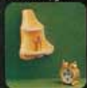
6626 Hornhylla. Fur. 6856 Väsoklocka.