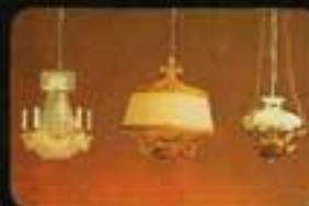
6142 Kristallkrona. 6138 Taklampa Modern. 6137 Taklampa fotogen.