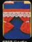
6352 Gardin Royal.