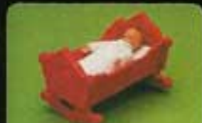
1271 Baby i vagn.