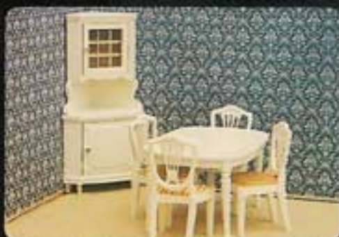
9406 Matsal Royal. 4361 Matbord Royal. 4365 Fyra stolar Royal. 4363 Hörnskåp Royal.