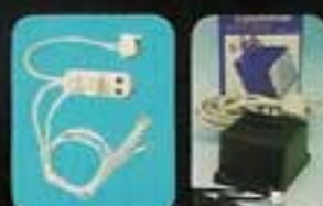
6120 Lampset för kök och badrum.