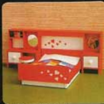
9722 Sovrum Scandinavia (finns endast komplett).