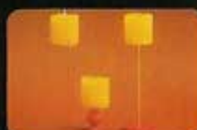
6106 Lampset, 3 gula lampor.