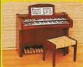
5498 Elorgel med pall.