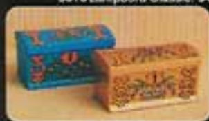
4400 Kista, blå 4402 Kista, guld.

5772 Öppen spis med belysning. 4405 Allmogesoffa, blå. 3141 Kökssoffa, röd. 5473 Snurråtölj Brasília. 5453 Snurråtölj, gul. 5486 Piano med pall. 4384 Klocka Royal. 5316 Lampbord Classic. 5484 Seteriset.