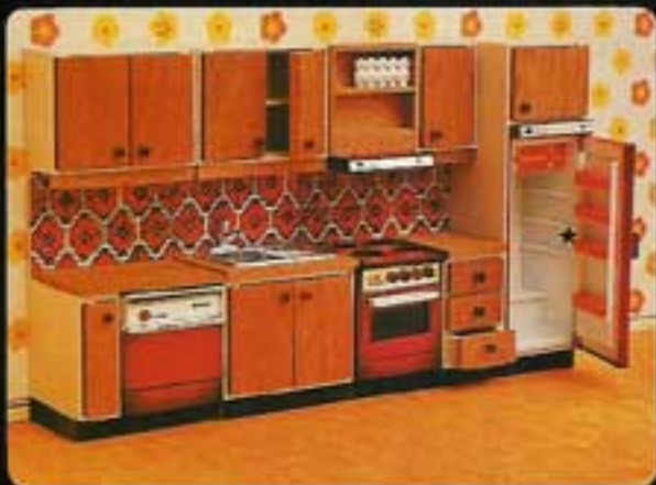
9276 Kök Continental IV. 2532 Kökspisenhet. 2542 Diskbänkenhet. 2552 Diskmaskin. 2562 Kylskåpsenhet.

Nu finns Lundby-köket med den moderna tonade röda färgen som blivit så omtyckt i riktiga villakök. Du har två köksinredningar att välja på: Continental III som innehåller kökspis med fläkt och överskåp samt arbetsbänk med utdragbara lådor och överskåp, diskbänksenhet och dessutom ett köksbord med två stolar. Kök Continental IV har samma spis och diskbänk och dessutom diskmaskin som går att öppna samt överskåp och ett kylskåp med hyllor, fack i dörrarna, grönsaksalåda och överskåp. Hål finns för lampor som lyser upp. Du kan använda lampseten nr 6120 (se sid 15) som är lätt att sätta in.