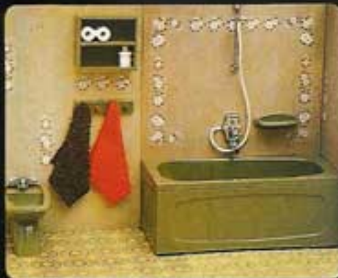
9867 Badrum i grönt kakel, II. 8833 Badkar med grön kakelvägg. 8835 Bidé med grön kakelvägg.