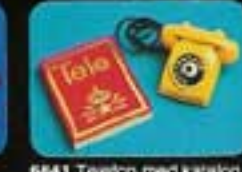
6841 Telefon med katalog.