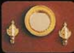
6854 Spegel med två lampetter.