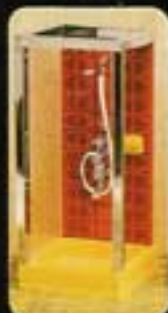
8844 Duschkabin, rött kakel.