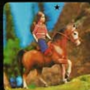
1301 Häst Golden Girl (säljs utan docka).