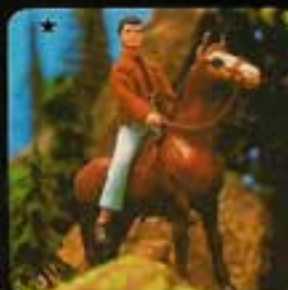
1300 Häst Golden Boy (säljs utan docka).