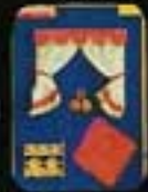
6321 Gardinset, kök.