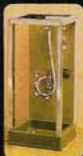
8831 Duschkabin, grönt kakel.