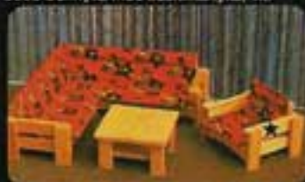
9531 Sofgrupp Fur. 5480 Hömskåp Fur. 5481 Fåtölj Fur. 5482 Sofbord Fur.