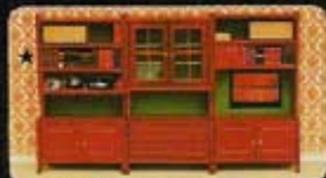
9542 Bokhyllvägg Classic. 5384 Vitinskåp Classic. 5385 Bokhylla Classic. 5386 Bokhylla med tidskriftshylla Classic.